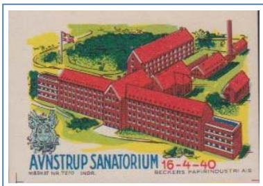
Avnstrup Sanatorium 1940