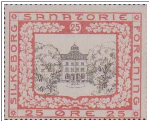
Silkeborg Sanatorium 1905